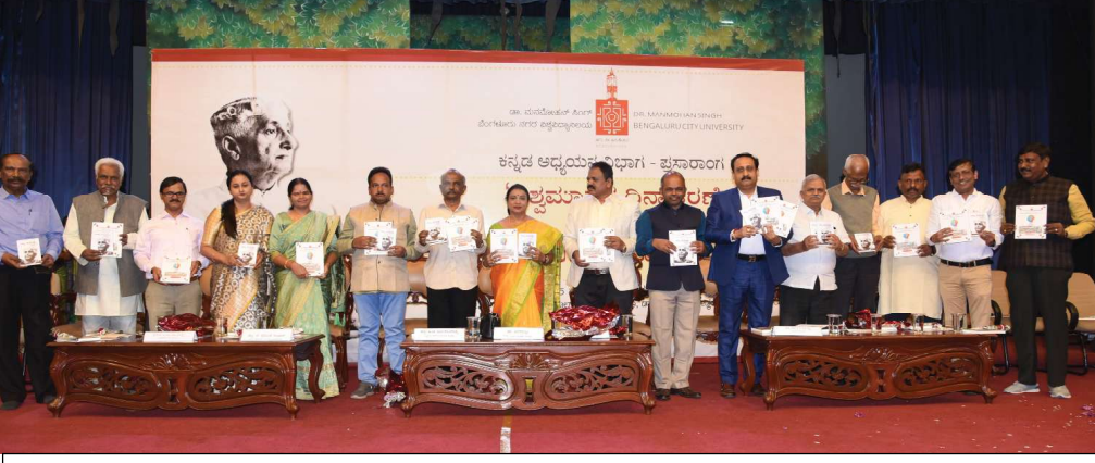
ಪುಸ್ತಕಗಳ ಬಿಡುಗಡೆ ಮೂಲಕ ಡಾ. ಮನಮೋಹನ್ ಸಿಂಗ್ ಬೆಂಗಳೂರು ನಗರ ವಿಶ್ವವಿದ್ಯಾನಿಲಯದ ಪ್ರಸಾರಾಂಗ ಉದ್ಘಾಟನೆ