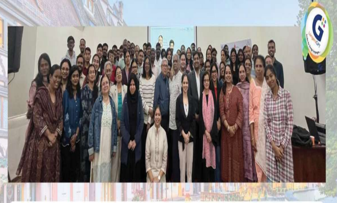
Participants of "La Magie de la Langue Française en Action avec L'IA."