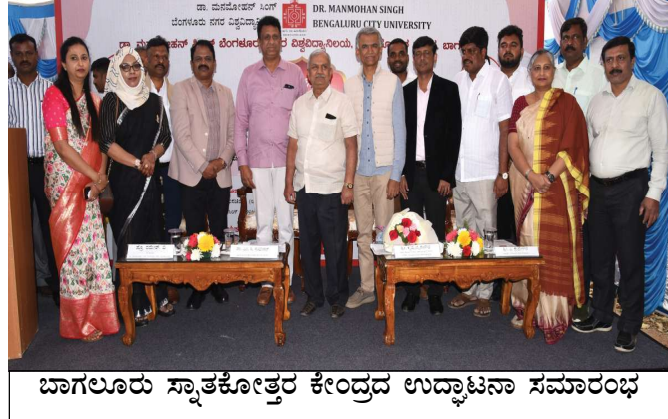
ಬಾಗಲೂರು ಸ್ನಾತಕೋತ್ತರ ಕೇಂದ್ರದ ಉದ್ಘಾಟನಾ ಸಮಾರಂಭ