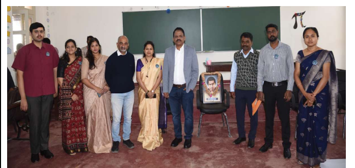
Faculty of Mathematics with VC at Math-O-Mania