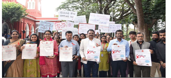
ವಿಶ್ವ ಏಡ್ಸ್ ದಿನಾಚರಣೆ ಅಂಗವಾಗಿ ಸೆಂಟ್ರಲ್ ಕಾಲೇಜಿನಲ್ಲಿ ವಿದ್ಯಾರ್ಥಿಗಳ ಜಾಥಾ