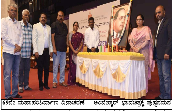
69ನೇ ಮಹಾಪರಿನಿರ್ವಾಣ ದಿನಾಚರಣೆ - ಅಂಬೇಡ್ಕರ್ ಭಾವಚಿತ್ರಕ್ಕೆ ಪುಷ್ಪನಮನ

ಖಾಯಂ ಬೋಧಕ- ಬೋಧಕೇತರ ಸಿಬ್ಬಂದಿಯ ತೀವ್ರ ಕೊರತೆಯಿಂದಾಗಿ ಸಾರ್ವಜನಿಕ ವಿಶ್ವವಿದ್ಯಾಲಯಗಳ ಭವಿಷ್ಯ ಕ್ರಮೇಣ ಮಸುಕಾಗುತ್ತಿದೆ ಎಂದು ಅವರು ಆತಂಕ ವ್ಯಕ್ತಪಡಿಸಿದರು. ಮಂಜೂರಾದ ಹುದ್ದೆಗಳನ್ನು ಅರ್ಹತೆ ಮತ್ತು ಮೀಸಲಾತಿ ಮಾನದಂಡಗಳಿಗೆ ಅನುಗುಣವಾಗಿ ಶೀಘ್ರವೇ ಭರ್ತಿ ಮಾಡಬೇಕೆಂದು ಅವರು ಸರ್ಕಾರವನ್ನು ಒತ್ತಾಯಿಸಿದರು.