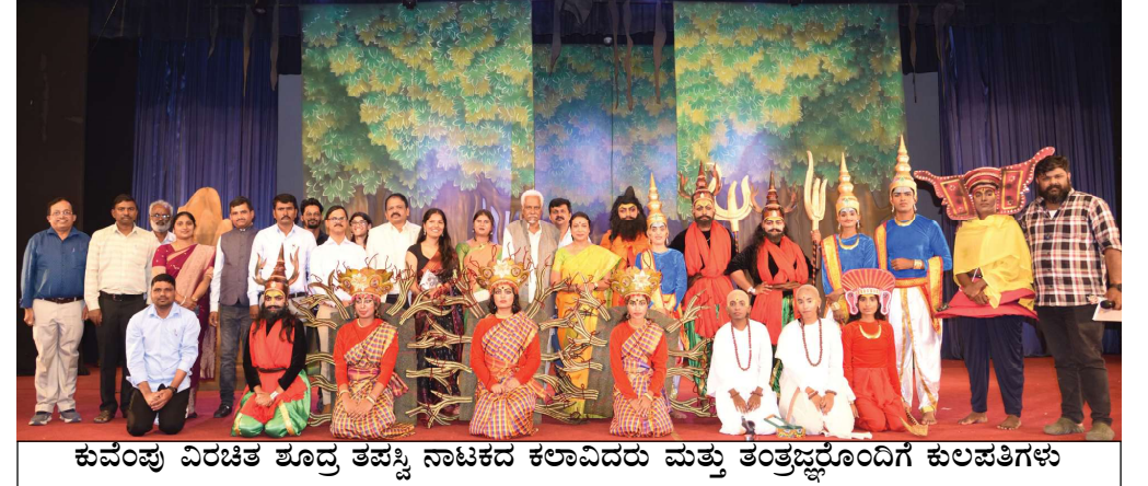
ಕುವೆಂಪು ವಿರಚಿತ ಶೂದ್ರ ತಪಸ್ವಿ ನಾಟಕದ ಕಲಾವಿದರು ಮತ್ತು ತಂತ್ರಜ್ಞರೊಂದಿಗೆ ಕುಲಪತಿಗಳು