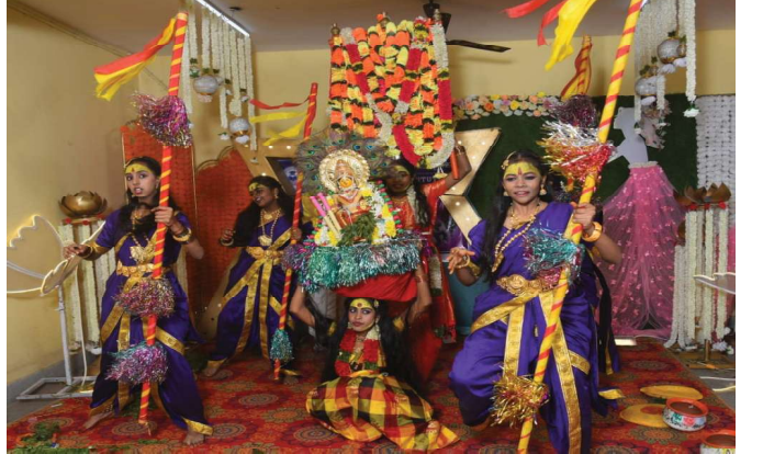
ಪ್ರಯುಕ್ತಿ ಕಾಲೇಜಿನ ವಿದ್ಯಾರ್ಥಿಗಳಿಂದ ಜಾನಪದ ನೃತ್ಯ ಪ್ರದರ್ಶನ