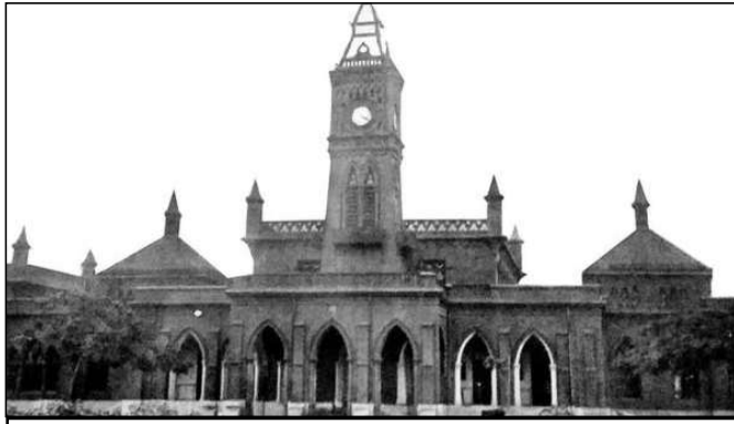
Old Photo of Central College

C. Rajagopalachari, and Prof. C.N.R. Rao, S.N. Jalingappa and D. Deva-raj Urs former Chief Ministers of Karnataka; Diwan Sir Mirza Ismail, Educationist Dr. H. Narasimhaiah; Kannada literary icons such as Masti Venkatesha Iyengar, V. Seetharamaiah,