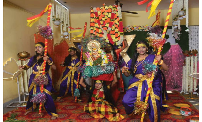
ಪ್ರಯುಕ್ತಿ ಕಾಲೇಜಿನ ವಿದ್ಯಾರ್ಥಿಗಳಿಂದ ಜಾನಪದ ನೃತ್ಯ ಪ್ರದರ್ಶನ