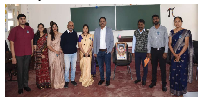
Faculty of Mathematics with VC at Math-O-Manina