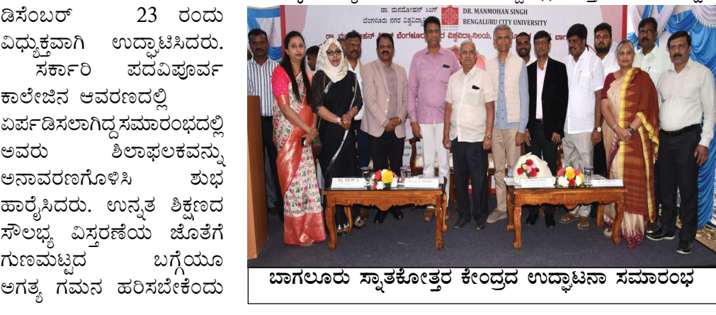
ಬಾಗಲೂರು ಸ್ನಾತಕೋತ್ತರ ಕೇಂದ್ರದ ಉದ್ಘಾಟನಾ ಸಮಾರಂಭ