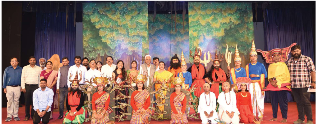
ಕುವೆಂಪು ವಿರಚಿತ ಶೂದ್ರ ತಪಸ್ವಿ ನಾಟಕದ ಕಲಾವಿದರು ಮತ್ತು ತಂತ್ರಜ್ಞರೊಂದಿಗೆ ಕುಲಪತಿಗಳು