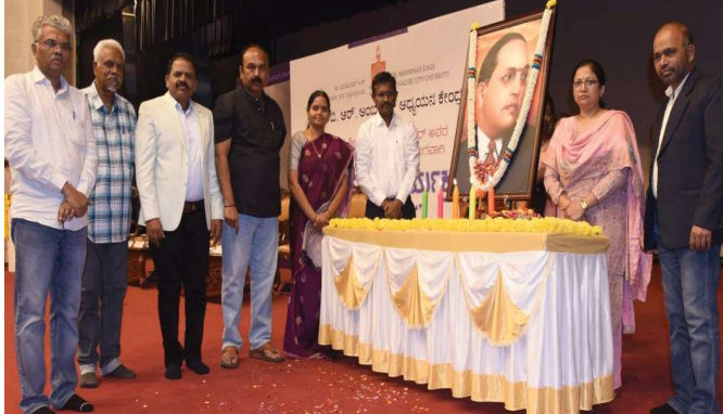
69ನೇ ಮಹಾಪರಿನಿರ್ವಾಣ ದಿನಾಚರಣೆ - ಅಂಬೇಡ್ಕರ್ ಭಾವಚಿತ್ರಕ್ಕೆ ಪುಷ್ಪನಮನ

ಡಾ. ಮನಮೋಹನ್ ಸಿಂಗ್ ಬೆಂಗಳೂರು ನಗರ ವಿಶ್ವವಿದ್ಯಾನಿಲಯದ ಡಾ. ಬಿ.ಆರ್. ಅಂಬೇಡ್ಕರ್ ಅಧ್ಯಯನ ಕೇಂದ್ರದ ವತಿಯಿಂದ 2025 ಡಿಸೆಂಬರ್ 6ರಂದು ಏರ್ಪಡಿಸಲಾಗಿದ್ದ 69ನೇ ಮಹಾಪರಿನಿರ್ವಾಣ ದಿನಾಚರಣೆ ಕಾರ್ಯಕ್ರಮವನ್ನು ಉದ್ಘಾಟಿಸಿ ಅವರು ಮಾತನಾಡಿದರು. ಖಾಯಂ ಬೋಧಕ-ಬೋಧಕೇತರ ಸಿಬ್ಬಂದಿಯ ತೀವ್ರ ಕೊರತೆಯಿಂದಾಗಿ ಸಾರ್ವಜನಿಕ ವಿಶ್ವವಿದ್ಯಾಲಯಗಳ ಭವಿಷ್ಯ ಕ್ರಮೇಣ ಮಸುಕಾಗುತ್ತಿದೆ ಎಂದು ಅವರು ಆತಂಕ ವ್ಯಕ್ತಪಡಿಸಿದರು. ಮಂಜೂರಾದ ಹುದ್ದೆಗಳನ್ನು ಅರ್ಹತೆ ಮತ್ತು ಮೀಸಲಾತಿ ಮಾನದಂಡಗಳಿಗೆ ಅನುಗುಣವಾಗಿ ಶೀಘ್ರವೇ ಭರ್ತಿ ಮಾಡಬೇಕೆಂದು ಅವರು ಸರ್ಕಾರವನ್ನು ಒತ್ತಾಯಿಸಿದರು.