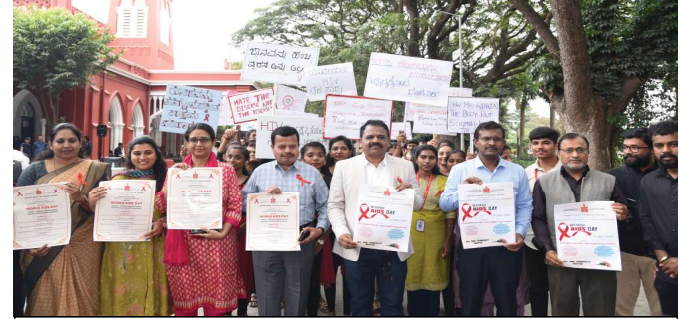
ವಿಶ್ವ ಏಡ್ಸ್ ದಿನಾಚರಣೆ ಅಂಗವಾಗಿ ಸೆಂಟ್ರಲ್ ಕಾಲೇಜಿನಲ್ಲಿ ವಿದ್ಯಾರ್ಥಿಗಳ ಜಾಥಾ