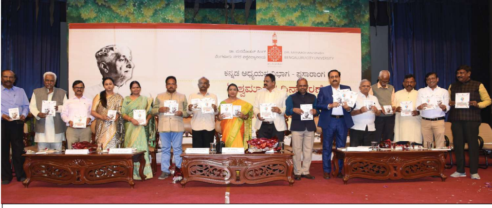
ಪುಸ್ತಕಗಳ ಬಿಡುಗಡೆ ಮೂಲಕ ಡಾ. ಮನಮೋಹನ್ ಸಿಂಗ್ ಬೆಂಗಳೂರು ನಗರ ವಿಶ್ವವಿದ್ಯಾನಿಲಯದ ಪ್ರಸಾರಾಂಗ ಉದ್ಘಾಟನೆ