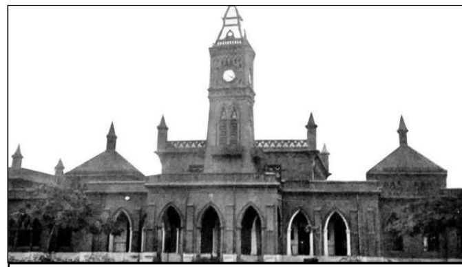
Old Photo of Central College