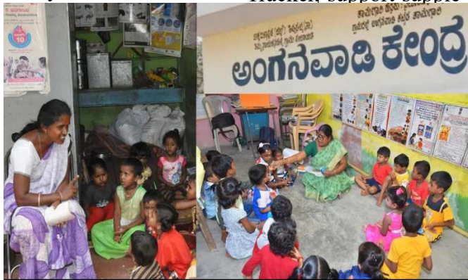
Anganawadi Centre

mentary nutrition distribution, monitor growth, conduct home visits, and assist in immunisation. Yet, many Anganwadi centres continue to function in inadequate buildings with poor infrastructure and limited teaching materials. The digital transformation of ICDS has added new layers of work without providing reliable connectivity, adequate training, or the devices needed to perform these tasks efficiently. Beyond their core ICDS duties, Anganwadi workers are increasingly assigned additional responsibilities during voter list revisions and election-related activities. Their tasks often include assisting surveys, conducting census operations, participating in health campaigns. Anganwadi workers are demanding fair wages, retirement benefits, and government-employee status.