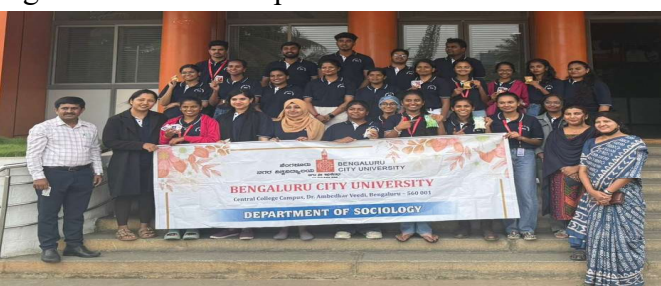
Sociology Faculty and Students at BAMUL Unit

cial lecture emphasising various methods to crack Competitive Exams. BAMUL Unit Visit The students and faculty of the Department of Sociology visited BAMUL - KMF unit in Bengaluru. - Dr. Savitha B C,